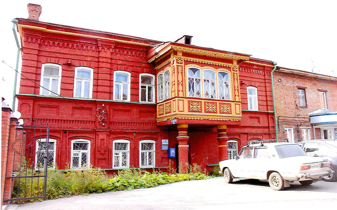
Видовая точка № 4. Северный (боковой) фасад здания с эркером. Вид с территории двора.