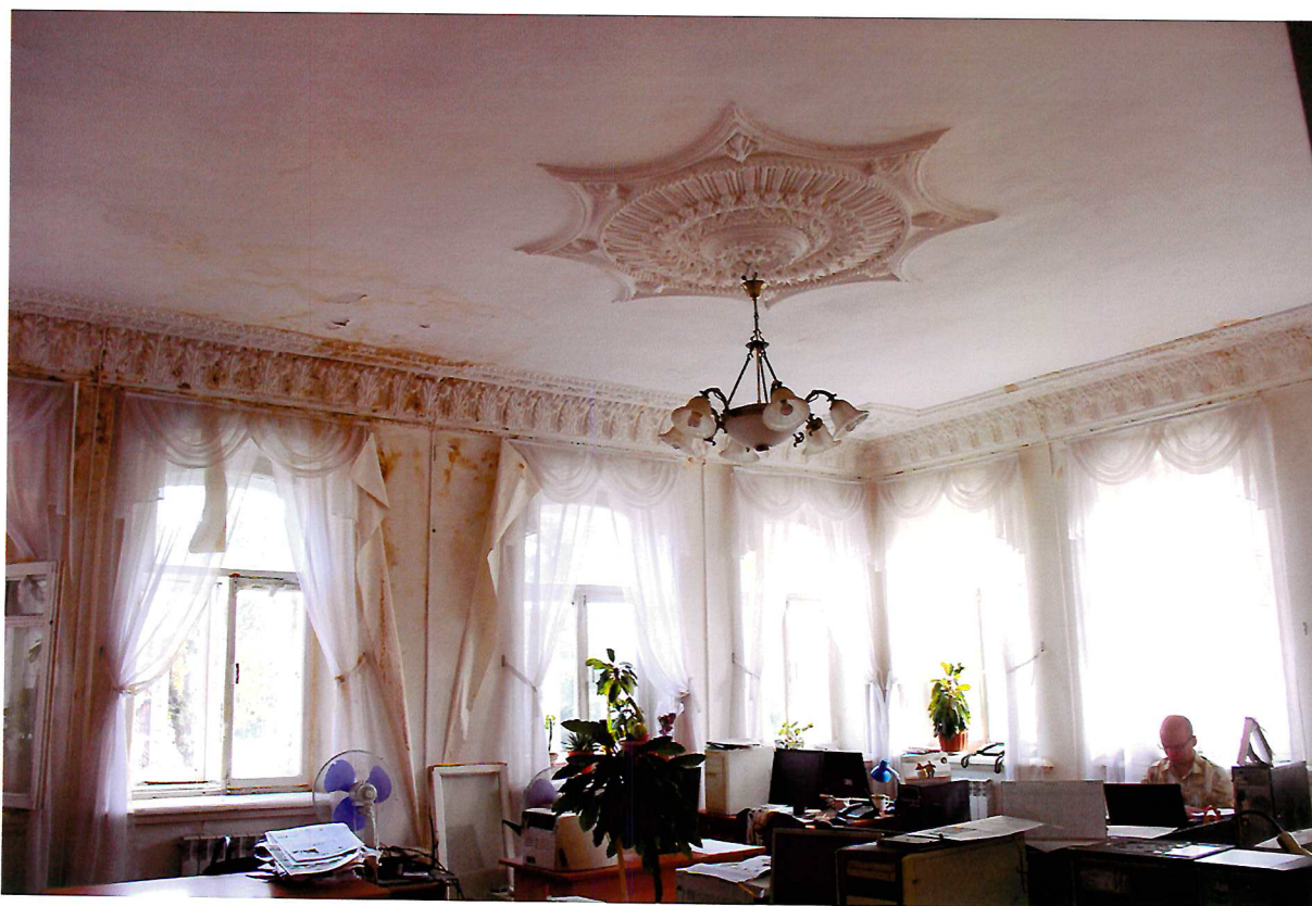
Видовая точка № 7. Интерьер залного помещения 2-го этажа (восточная часть здания).