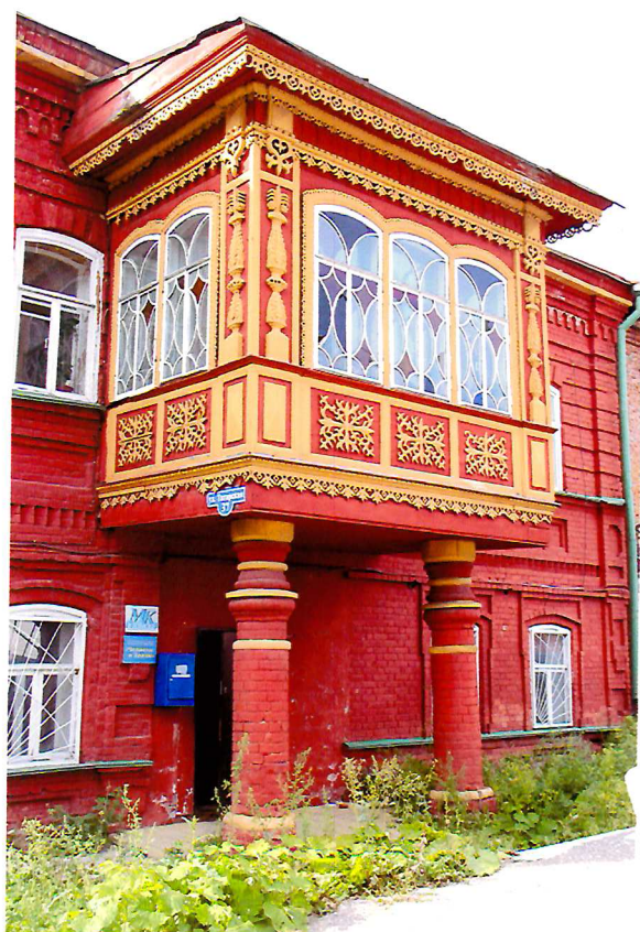
Видовая точка № 5. Фрагмент бокового фасада. Деревянный эркер.