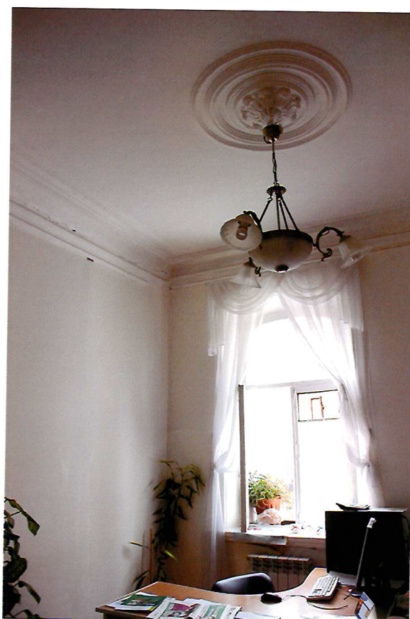
Видовая точка № 9. Интерьер помещения 2-го этажа (восточная часть здания).