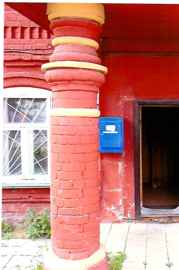
Видовая точка № 6. Кирпичная колонна эркера.