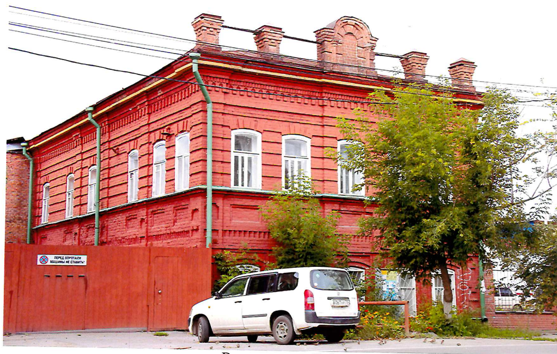
Видовая точка № 1. Главный (восточный) фасад здания. Вид с ул. Татарской.

дата съемки: 31.08.2017 г.