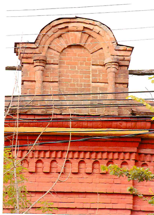
Видовая точка № 3. Фрагмент главного фасада. Аттик.