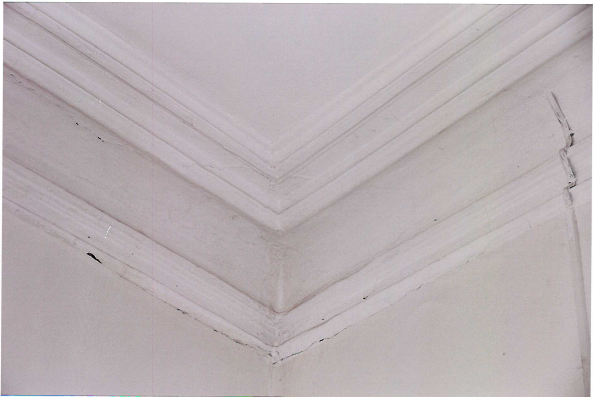
Видовая точка № 13. Декоративное оформление интерьера помещения 2-го этажа. Фрагмент потолочно-стеновой штукатурной тяги.