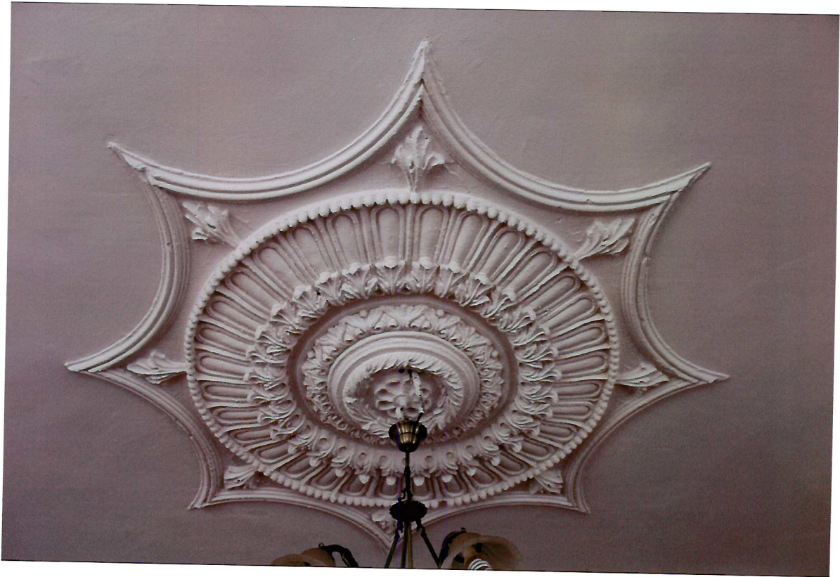
Видовая точка № 10. Декоративное оформление интерьера зального помещения 2-го этажа. Потолочная розетка.