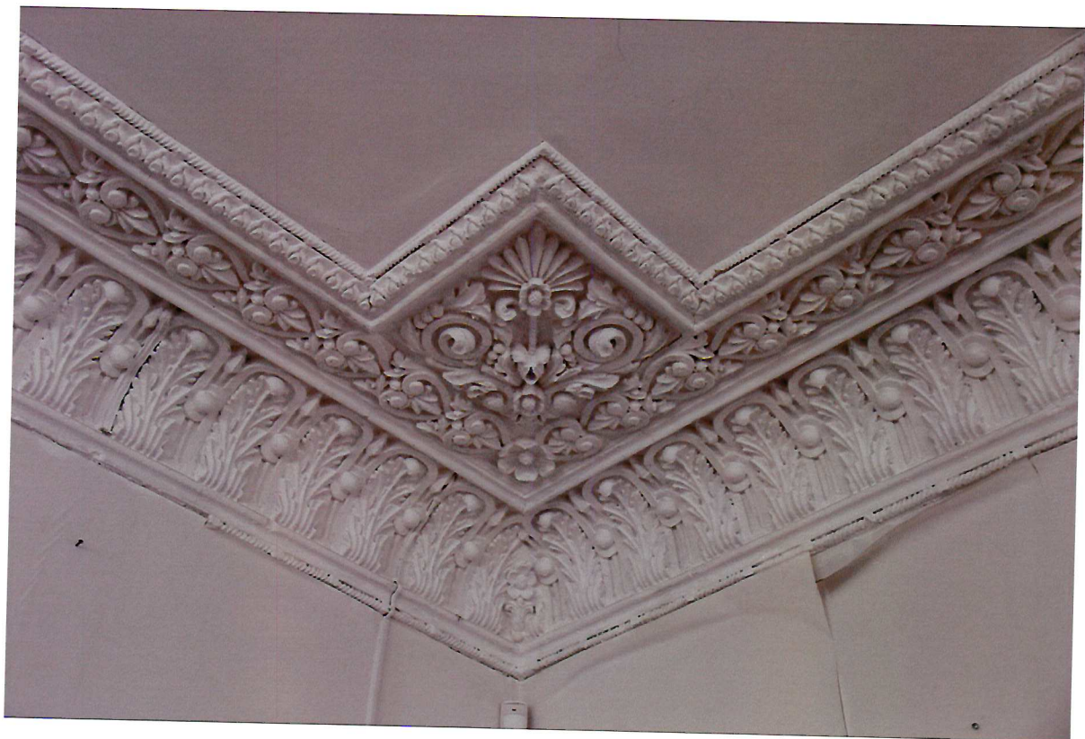
Видовая точка № 11. Декоративное оформление интерьера зального помещения 2-го этажа. Фрагмент лепного декора потолка.