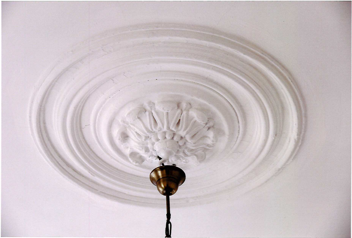
Видовая точка № 12. Декоративное оформление интерьера помещения 2-го этажа. Потолочная розетка.