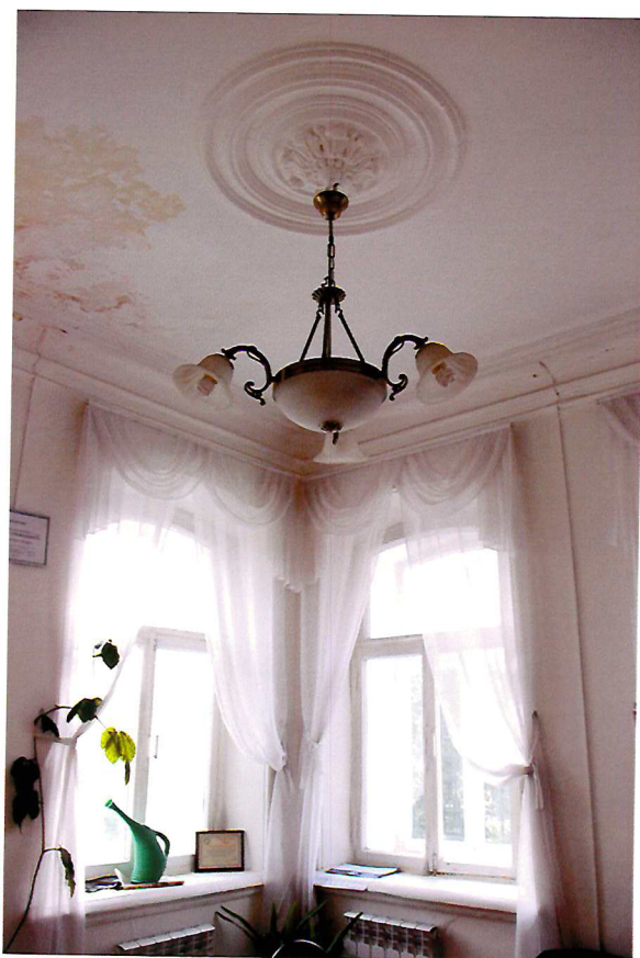
Видовая точка № 8. Интерьер помещения 2-го этажа (восточная часть здания).